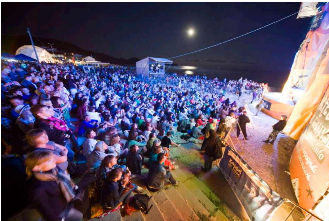
Mer noire, Lune bleue et Nuit blanche au son du 'Bon Temps' de Chaek à Koktebel (2012)