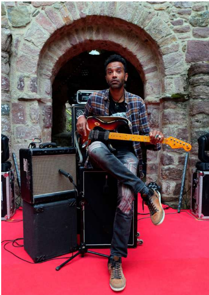
Lors du Festival 'Les Routes de Lanleff' (2019)

Pour des Pépites vagabondes aux accents de blues, RDV aux prochains concerts