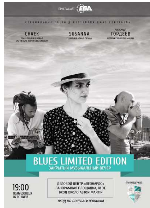
Tournée été 2012 Yalta, Donetsk, Kharkov, Kiev.

Concert géant à Koktebel, Crimée ou Sziget Festival Hongrie, et des dizaines d'autres à travers toute la Russie..