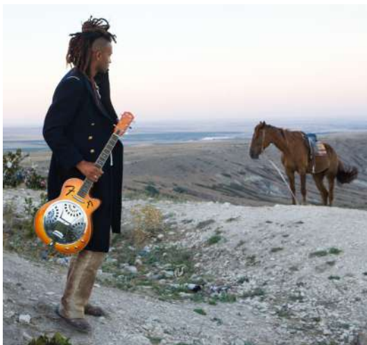
Au bord du cratère á Yra (Crimée) 2011