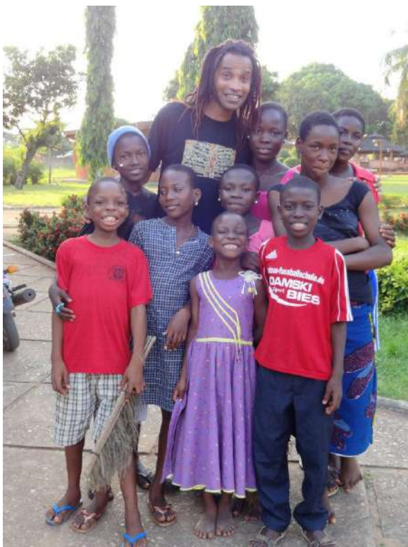
Avec les petits frères de SOS Villages d'Enfants à Cotonou 2013