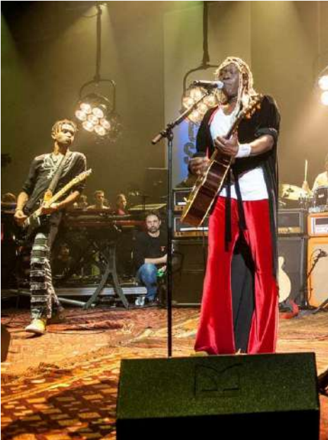
Tournage ARTE 'One Shot Not' (2008)