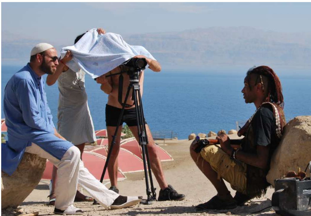
Tournage en Israël du documentaire 'Life & Healing therapies' de Caroline Omya (Janis Prod) 2013

https://www.mymajorcompany.com/casse-muraille