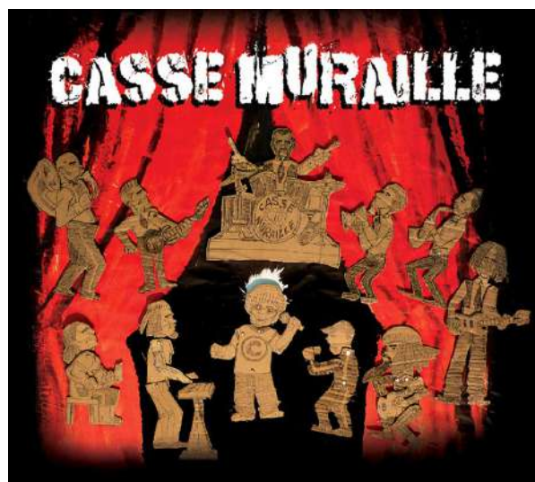
Production d'un album en milieu carcéral