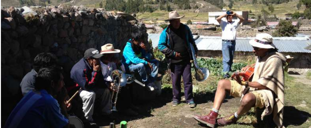
Rencontre avec des musicos locaux á Condorcuyo (Pérou) 2014