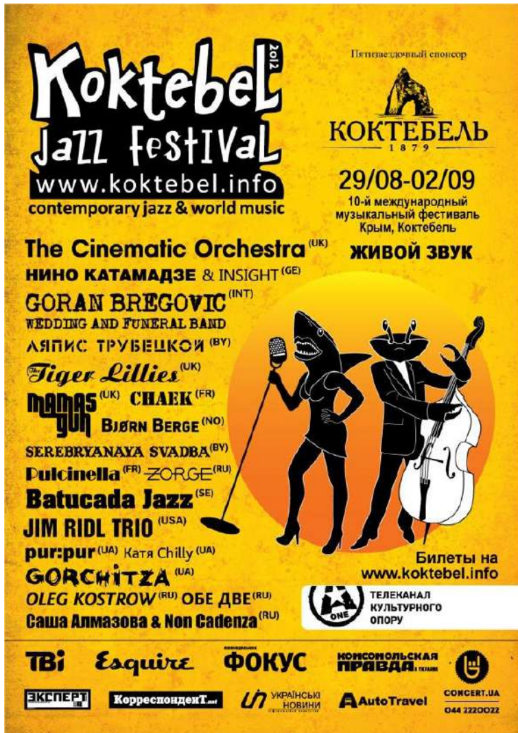
A l'affiche du plus grand festival de l'ère post soviétique en Ukraine

Concert géant à Koktebel, Crimée ou Sziget Festival Hongrie, et des dizaines d'autres à travers toute la Russie..