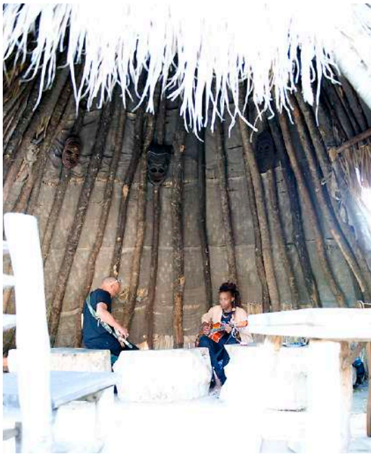
Creation Hut near Feodosia (Crimea). 2010

•Les années d'errance, multiples expériences riches en rencontres artistiques: en Amérique du Sud , en Asie, substances interdites, introspection, sérénité du Chaman, l'amour de la vie de bluesman quoi !